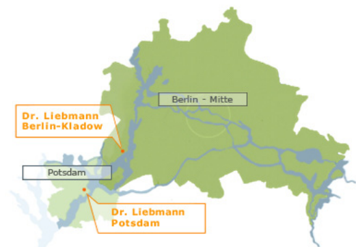
Lage in Berlin/ Potsdam