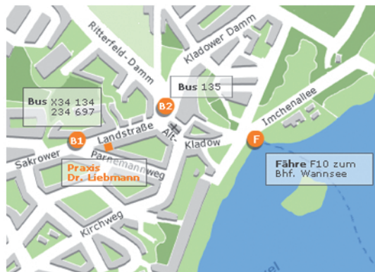
Lage in Berlin-Kladow

Mo, Mi, Fr 9–14 Di, Do 14–19 Alle Kassen und Privat.